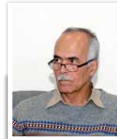
مهندس احد ذوالرحمی دبیرانجمن ستصا

۳- تدارک مواد اولیه مباد اولیه مورد نیاز تولید پس از نیروی انسانی از مهم‌ترین عوامل تولید محسوب می‌شود که لازم است برای تسدایم و رونق در تولید، این مواد اولیه بدون مشکلات خاص تامین و به خط تولید و پروژه‌ها تزریق گردد. مباد اولیه سازندگان تجهیزات صنعتی نیز از تنوع نسبی برخوردار است. برای خرید مباد اولیه خارجی نیاز به ارز وجود دارد که لازم است بانک مرکزی و نهادهای مرتبط مثل وزارت صمت حمایت‌های لازم را در این خصوص به عمل آورند. مواردی که می‌تواند بخشی از مشکلات موجود در این امر را هموار کند عبارتند از: ارائه مجوز واردات مواد اولیه بدون انتقال ارز، اختصاص بخشی از ارز حاصل از صادرات هر شرکت جهت انجام خریدهای خارجی مورد نیاز تسویه حساب ارزی خریدهای یوزانسی به تاریخ خرید آنها اختصاص ارز لازم به صادرکنندگان جهت مراجعات مکرر به خارج از کشور و سایر نیازهای ارزی